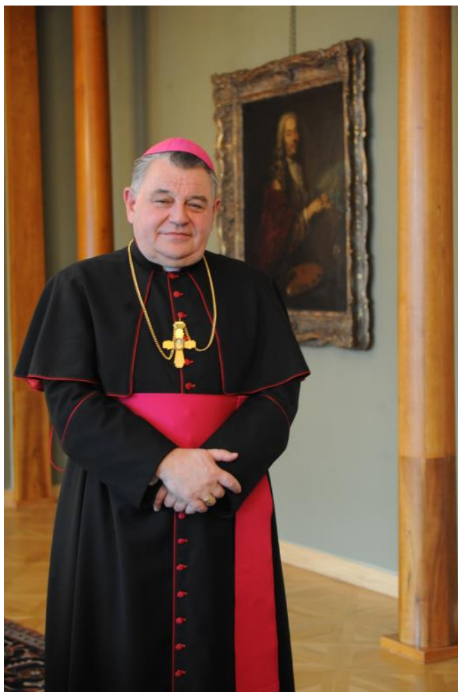
Dominik kardinál Duka

Přeji nám, všem členům a přátelům Kolpingova díla, hluboké a radostné prožití Velikonoc v jubilejním roce 2018.