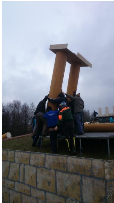
Fotografie ze zkoušek, stavby kulisy a zasněžené scény v úterý 31.3., kdy se Pašije měly hrát.