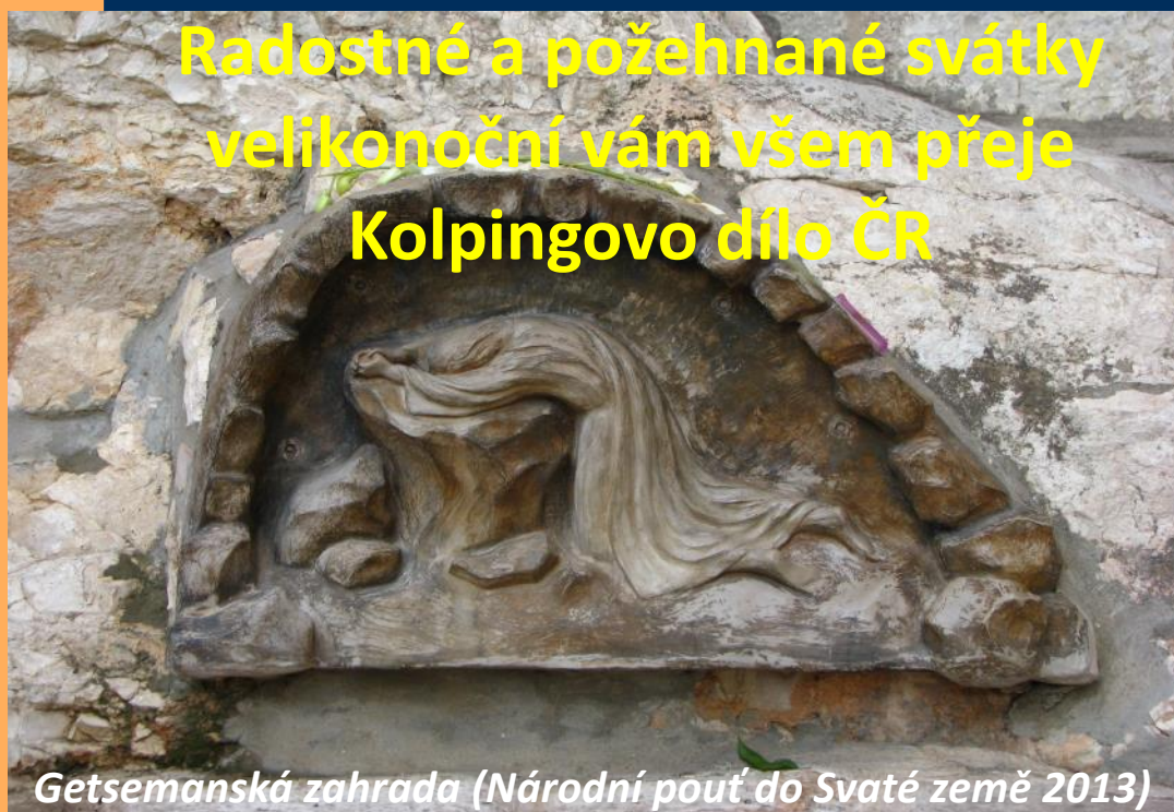
Getsemanská zahrada (Národní pout' do Svaté země 2013)

Radostné a požehnané svátky velikonoční vám všem přeje Kolpingovo dílo ČR