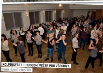
KOLPINGFEST – HUDEBNÍ VEČER PRO VŠECHNY. Předtím hlavně mladí lidé.