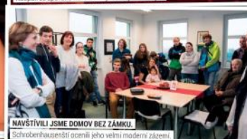
NAVŠTÍVILI JSME ODMOV BEZ ZÁMKU. Schrobenuhousenští ocenili jeho velmi moderní zájem.

KOLPINGOVY RODINY VELKÁ BÍTEŠ A SCHROBENHAUSEN