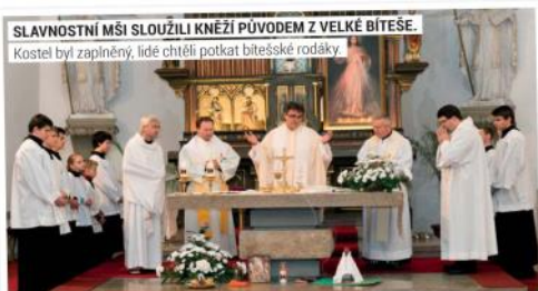
SLAVNOSTNÍ MŠI SLOUŽILI KNĚŽI PŮVODEM Z VELKÉ BÍTEŠE. Kostel byl zaplněný, lidé chtěli potkat bitešské rodáky.