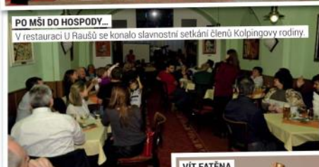
PO MŠI DO HOSPODY... V restauraci U Raušů se konala slavnostní setkání členů Kolpingovy rodiny.