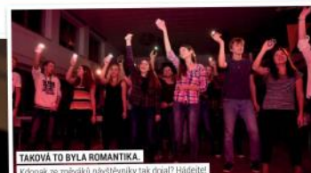
TAKOVÁ TO BYLA ROMANTIKA. Kobouk ze zpěváka návštěvníky tak očaral? Hladíte!