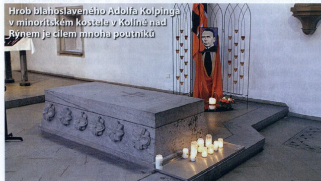
Hrob blahoslaveného Adolfa Kolpinga v minoritském kostele v Kolíně nad Rýnem je cílem mnoha poutníků