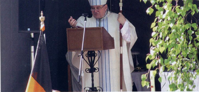
Arcibiskup Dominik Duka letos 20. října sloužil mši ve Žďáru nad Sázavou na oslavu jubilejních dvaceti let Kolpingova díla

v Německu, Rakousku, Švýcarsku, v USA, v Kanadě a v Austrálii. Z těchto zemí vysílá své apoštoly do třetího světa. Kolpingovy rodiny vznikaly v posledních dvaceti letech také v Mexiku a v Jižní Americe, v Jihoafrické republice, Ugandě, Keni a Indii. V Asii pracuje stovka skupin, které budují střediska pro učně a výrobu, seznamují obyvatelstvo s křesťanstvím a nabízejí i duchovní pomoc.