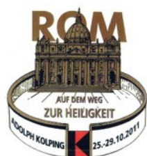
POUŤ KOLPINGOVA DÍLA DO ŘÍMA, 25. – 29.10.2011 „Na cestě ke svatosti“

V pondělí 24. října se vypravil na dlouhou cestu autobus plný poutníků Kolpingova díla, které oslovila naše nabídka k cestě do „věčného města“ Říma, která však neměla mít jen turistickou, či duchovní náplň (i když obojího jsme si užili do sytosti), ale byla to jedinečná příležitost zažít společenství lidí z celého světa, které spojují myšlenky sociálního reformátora Adolpha Kolpinga. Ten byl v Římě v roce 1991 blahorečen papežem Janem Pavlem II. a my jsme se tak mohli účastnit oslav 20. výročí této události.