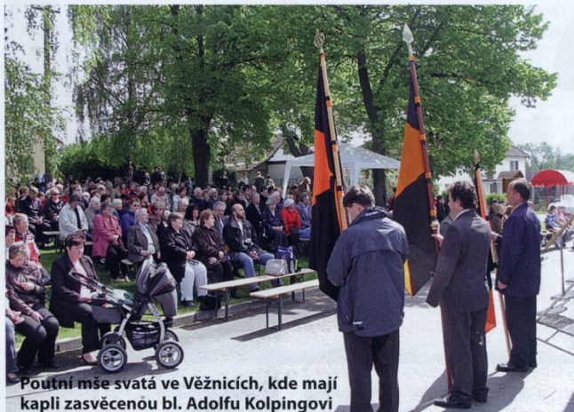
Poutní mše svatá ve Věžnicích, kde mají kapli zasvěcenou bl. Adolfu Kolpingovi