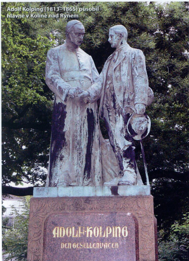
Adolf Kolping (1813–1865) působil hlavně v Kolíně nad Rýnem