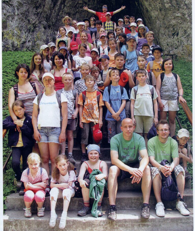
Dětský tábor na Vyhlídce v Moravském krasu je také dílem Kolpingovy rodiny