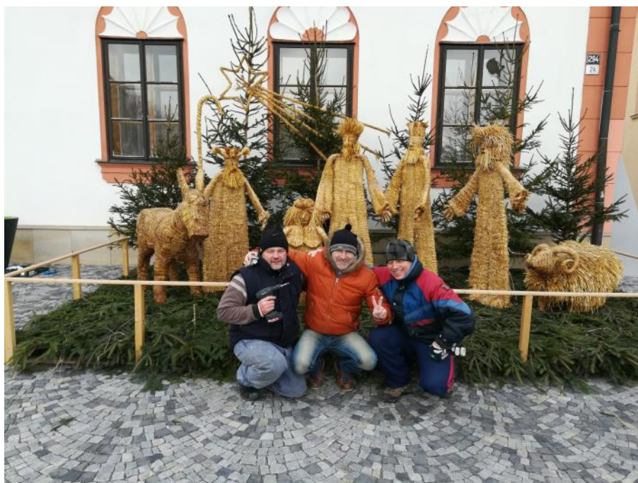
Foto z prosincové instalace Slámového betléma na žďárském náměstí.

Svoje příspěvky, dotazy nebo náměty zasílejte na adresu kolping@kolping.cz nebo poštou na adresu: