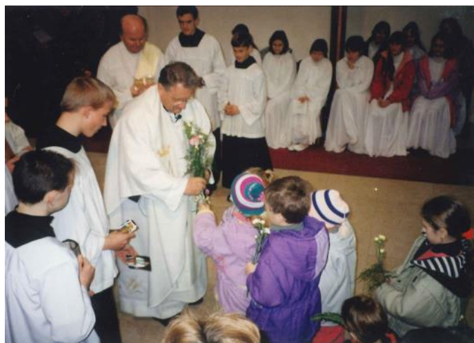
Fotky z oslav 60 narozenin otce Tiška v roce 1998 zachycují děkovnou mši svatou a následné oslavy v jídelně Sázava včetně jeho nefalšované radosti z darovaného kabátu.