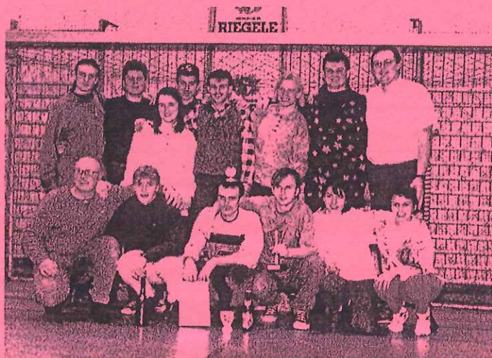
Družstvo ze Žďáru nad Sázavou a jeho příznivci

S pocitem dobře vykonané práce jsme se večer vydali na zpáteční cestu.