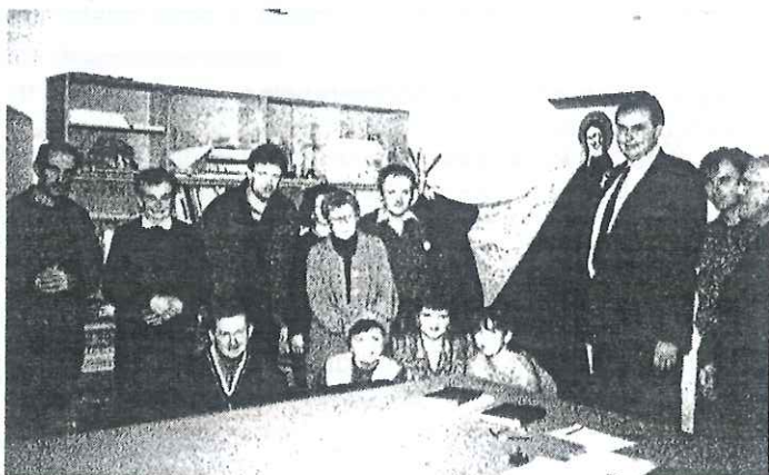
generální sekretář předává vlajku Kolpingově rodině Kunštát