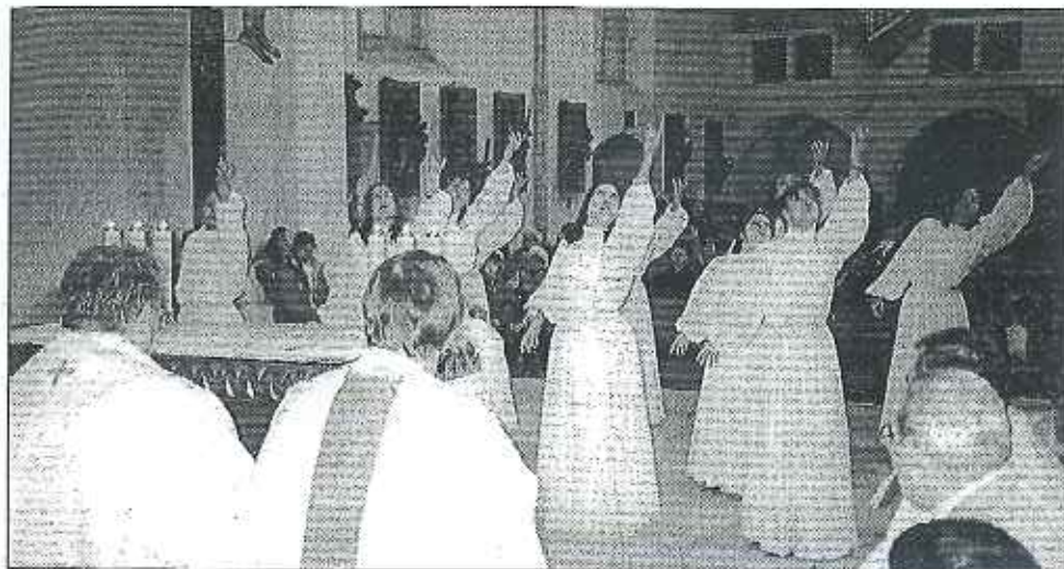
Velmi působivý byl tzv. liturgický tanec.