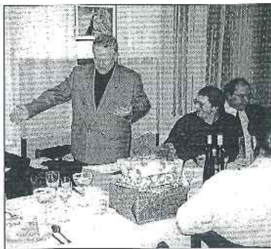
Oslavenec se rozplývá nad všemi dárky, kterými byl obdarován.

Vážné Kolpingovy rodiny, dovoďte nám srdečně Vás pozvat na: