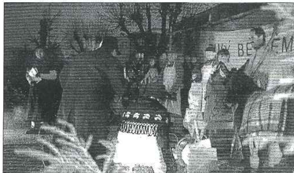
Koledníci se klaní před jesličkami na zaplněném žďárském náměstí.

Ve čtvrtek 18. prosince připravilo Kopingovo dílo ve spolupráci s Biskupským gymnáziem A. Kolpinga jedinečný zážitek pro žďárské občany a především pak pro děti. Na náměstí vyrostla přes noc jeskyně s jesličkami a v 15.30 hodin začalo představení nazvané Živý Betlém.