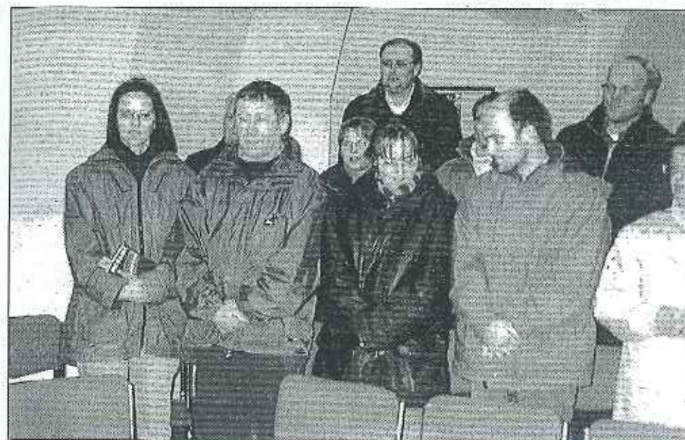
Kolpingova rodina Hőchstădt.