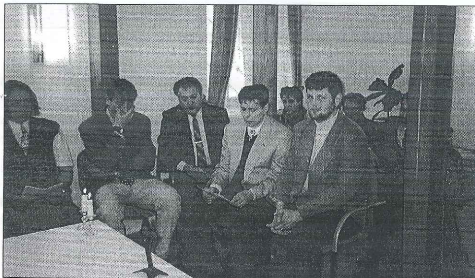
Kaple v budově Kolpingova díla ve Žďáře nad Sázavou slouží jako místo pro sloužení mše svaté při mnohých setkáních, které se zde konají.