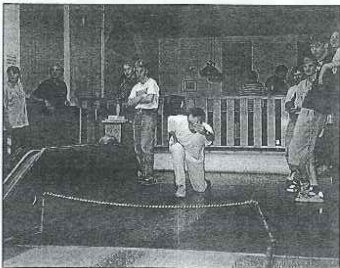
Zvláště kuželna byla místem, kde jsme trávili hodně času.