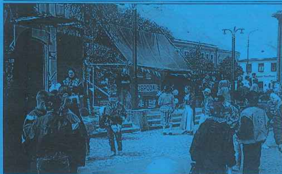
Příjemné páteční odpoledne v Pohůdkovém městě.