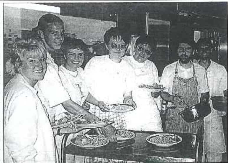
V tyto dny se také hodně vařilo.

dílo ČR, Biskupské gymnázium a Střední odborné učiliště Adolpha Kolpinga. Byla to vhodná příležitost zviditelnit výsledky několikaleté spolupráce. Pro hosty bylo připraveno slavnostní pohostění. Nabízely se chlebíčky, zákusky, z českých pokrmů vepřová a svičková.