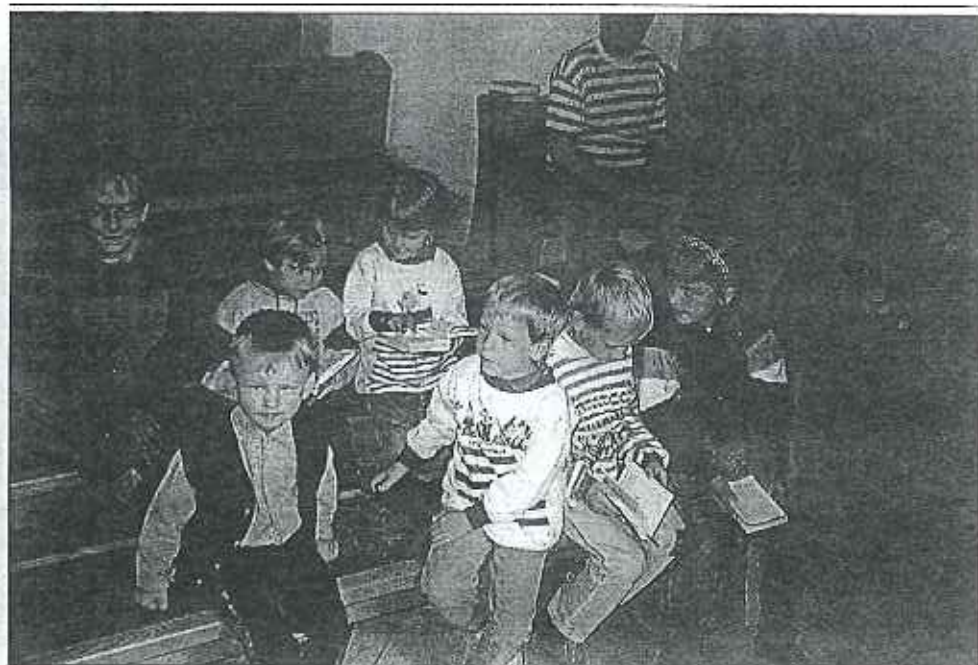
„Dětský koutek“ v telnickém kostele při mši svaté.

se hlavně díky krásnému počasí hrál tenis, volejbal, nohejbal, kuželky, stolní tenis, kulečník a slézala se horolezecká stěna. Malé děti, které zde byly se svými rodiči, relaxovaly po svém. Sjížděly po skluzavkách, lezly na prolézačkách ..... prostě pohoda.