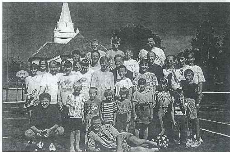
Jak je patrné z tváří účastníků, Relaxační dny v Telnici se opravdu povedly.