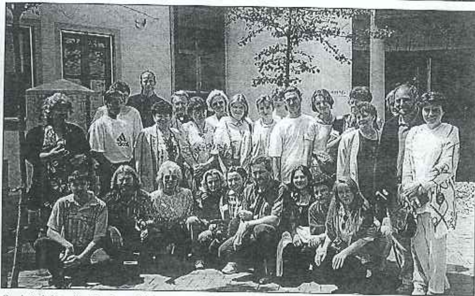
Společné foto před budovou Kolpingova díla v Augsburgu.

Kolpingovo dílo České republiky již pátým rokem spolupracuje s Kolpingovým dílem Augsburg. První kontakt započal právě zde a odtud také vzešly první projekty (kurzy, semináře, fotbalové turnaje a mnoho dalších aktivit).