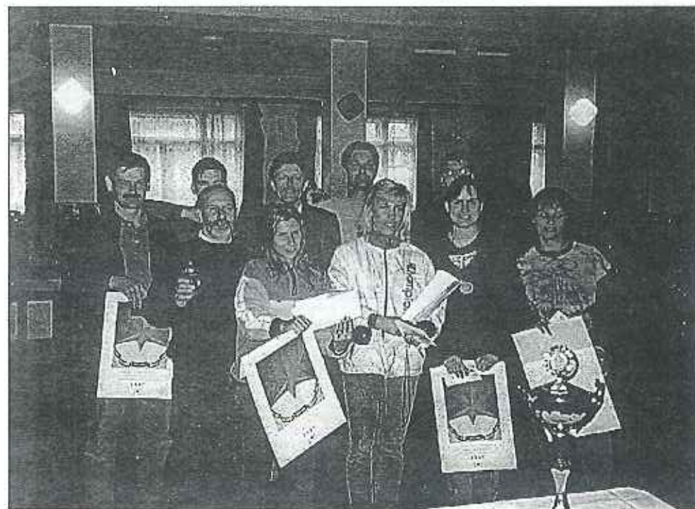
Družstvo ze Szentendre z Maďarska, které si obsadilo až poslední místo, ale jeho členům to, jak je vidno z fotografie, vůbec nevadilo.