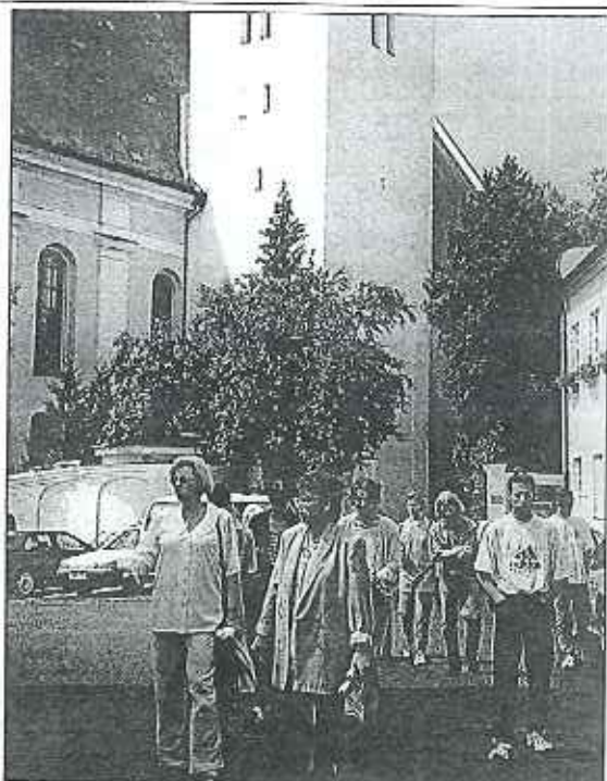
Při prohlídce historického města Donauvört.