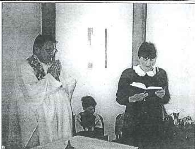
Při společné mši svaté sloužené v kapli v Kolpingově domě.