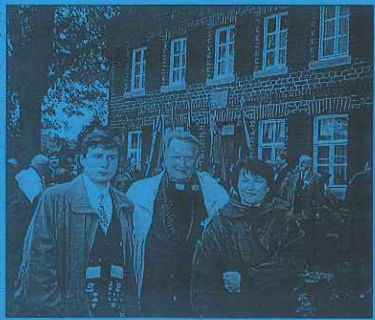
Trí zástupci z České republiky před rodným domem blahoslaveného Adolpha Kolpinga v Kerpeni.

tou, která byla pojata velmi slavnostně jako celé toto zasedání. Účastníci o-