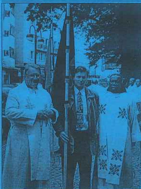
Toto shromáždění bylo, jak je patrné, opravdu mezinárodní.

běžného průvodu byli oblečeni do národních krojů a v průběhu mše svaté se zpívaly národní písně.