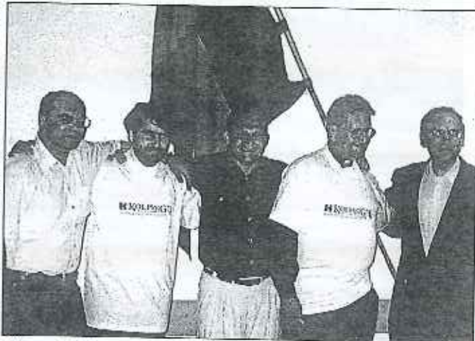
Zástupci Kolpingovy rodiny Žďár nad Sázavou si našli chvíli, aby navštívili v nedalekém Höchstädtu svoji družební Kolpingovu rodinu.

Jedna velmi zdařilá akce proběhla v polovině června v budově Kolpingova díla v Augsburgu, kde se prezentovalo Kolpingovo